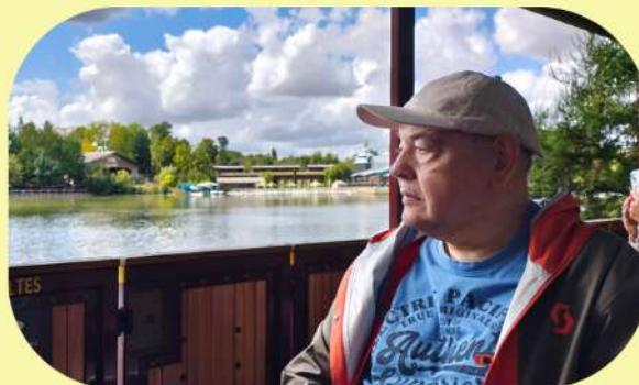
Didier à Pairi Daiza en Aout 2025