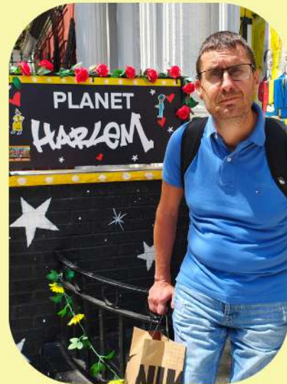
Johnny à New York en Juillet 2025