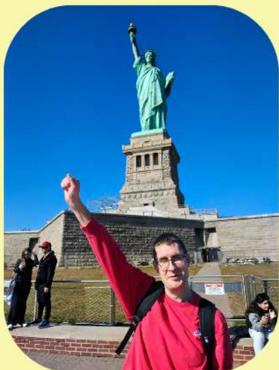
Johnny à New York en Octobre 2024